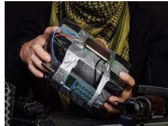
Использование самодельного взрывного устройства