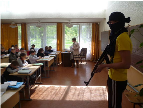
Использование огнестрельного оружия